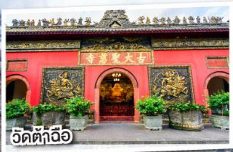
วัดต้าฉีอ้อ