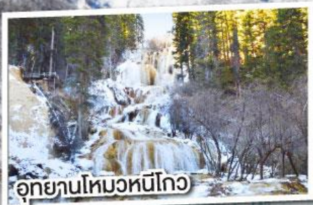
อุทยานโหมวหนี่โกว