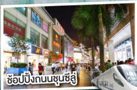
ช้อปปิ้งถนนชุนชิว