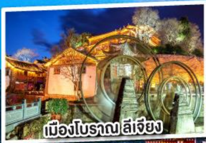
เมืองโบราณ ลี้เจียง