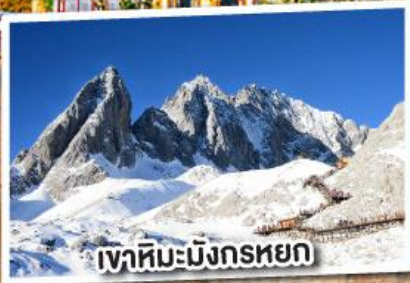
เขาสหิมะมังกรหยก