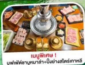
เมนูพิเศษ!