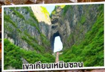
เงาเทียนเหมินซวน