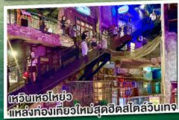
ช้อปปิ้งไฮโซ