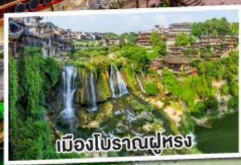
เมืองโบราณฟุหลง