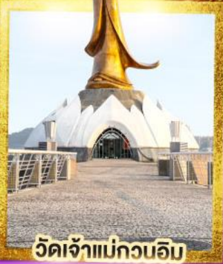
วัดเจ้าแม่กวนอิม