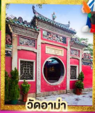
วัดอาบ่า