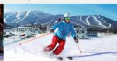
ลานสกียาปูสี

*ทางบริษัทฯ ขอสงวนสิทธิ์ในการสลับโปรแกรมทัวร์ตามความเหมาะสมขึ้นอยู่กับสถานการณ์หน้างาน โดยคำนึงถึงผลประโยชน์ของลูกค้าเป็นสำคัญ