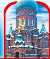
โบสถ์โซเฟีย

เที่ยว 6 วัน 4 คืน ธันวาคม 67 - กุมภาพันธ์ 68