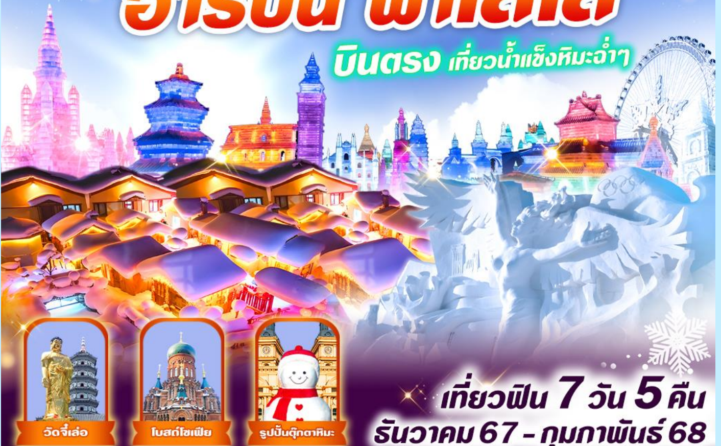
วัดจีเล่อ