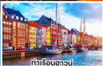
ท่าเรือชวานี

เดินทาง 19-26 พ.ย. 67 03-10 ธ.ค. 67 26 ธ.ค. 67-02 ม.ค. 68 (ปีใหม่)