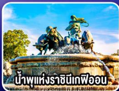
น้ำพุแห่งราชินีเกฟิออน