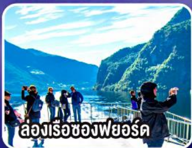
ล่องเรือชมความงามของฟยอร์ด