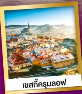
เซสก็ครุมลอฟ