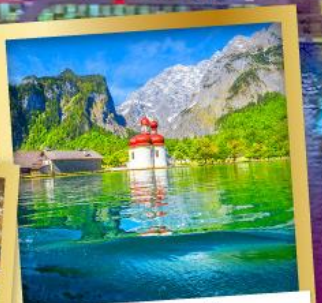
เบีร์ชเต็ทกาเดิน