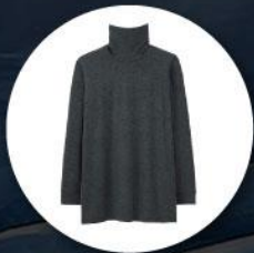
Heattech (ฮิกเทค) แบบหนาพิเศษ ทั้งกางเกงและเสื้อ

1. เสื้อผ้าควรเตรียมเสื้อผ้าสำหรับป้องกันความหนาวใช้ในอุณหภูมิต่ำสุด -40 องศาโดยประมาณ