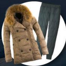
เสื้อและกางเกง กันหนาว, กันลม