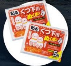
แผ่นความร้อนสำหรับ ให้ความอบอุ่นร่างกาย

2. บนเกาะโอลค์ฮอนจะมีอากาศหนาวมากต้องเตรียมกระติกน้ำเก็บความร้อนแบบพกพาได้ไปด้วย เพื่อต้มน้ำให้ความอบอุ่นร่างกาย