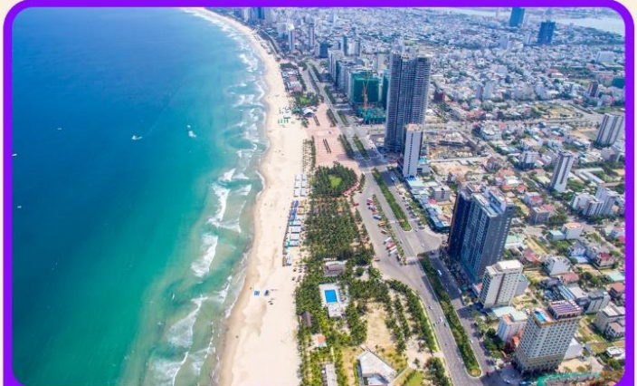
เช็คอิน ชายหาดหมีเคอ เป็นชายหาดที่สวยงามที่สุดในเมืองดานัง