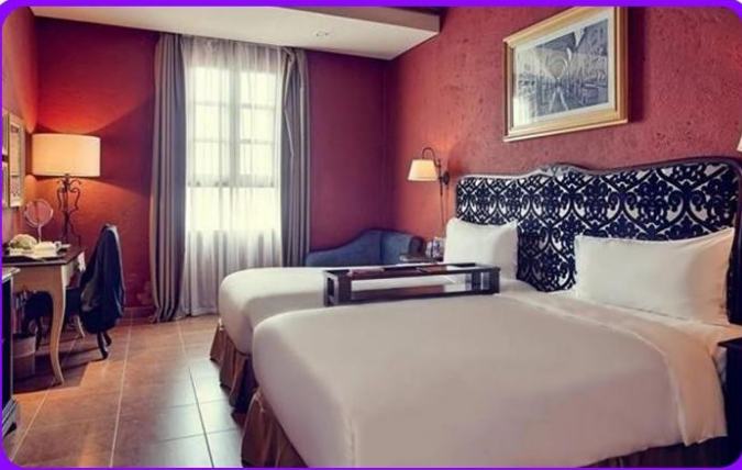
พักบนบานาฮิลล์ 1 คืน