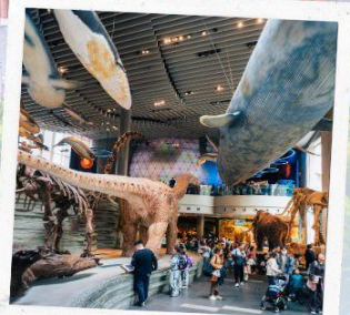
Shanghai Natural history Museum