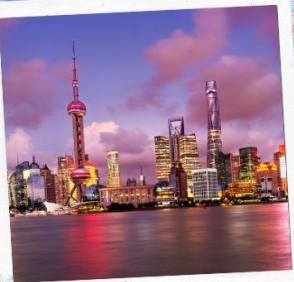
ชมวิวยามค่ำคืน