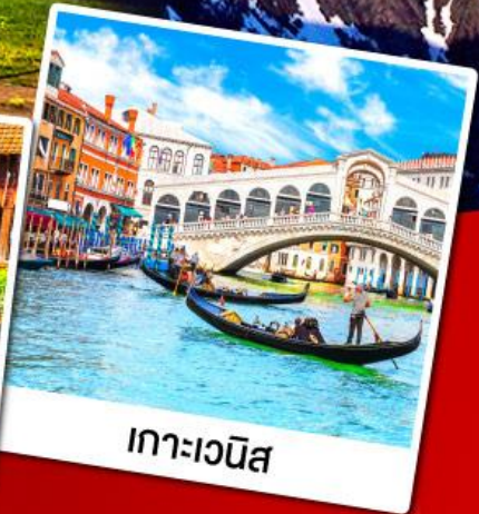
เกาะเวนิส