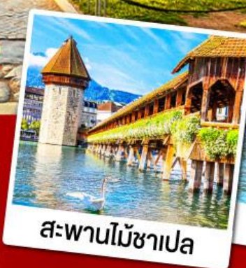
สะพานไม้ชาเปล

30 พ.ย.-08 ธ.ค., 08-16 ธ.ค.67 28 ธ.ค.-05 ม.ค., 11-19 ก.พ.68 08-16, 15-23 มี.ค.68 09-17 เม.ย.68