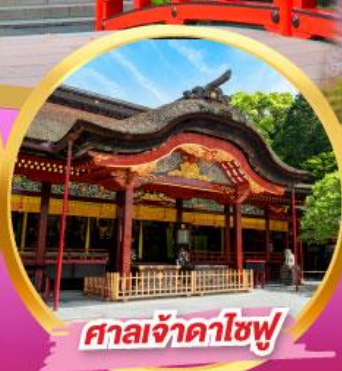
ศาลเจ้าคาไซฟู