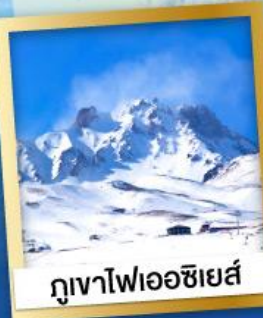
ภูเขาไฟเอซียส์