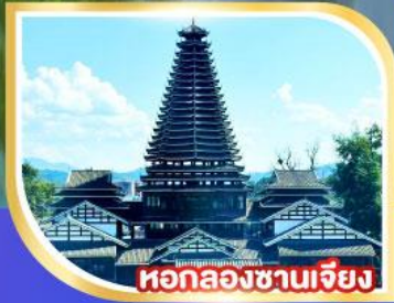
หอกลองซานเจียง