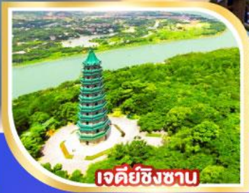
เจดีย์ชิงซาน