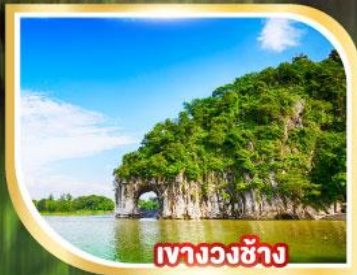
เงาวงช้าง