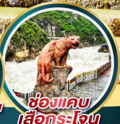
ช่องแคบ เลือกระใจ