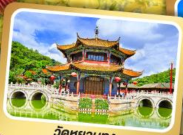
วัดห้วยทอง