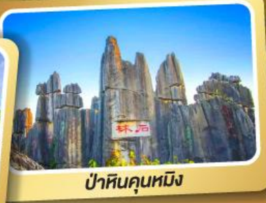
ป่าหินคุณหมิง