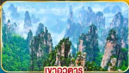
เชาอวดาร