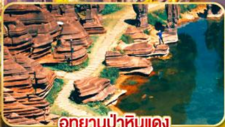
อุทยานป่าหินแดง