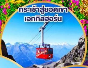
กระเช้าสู่ยอดเขา เอกทิสฮอร์น

รถไฟกลาเซียร์เอ็กซ์เพรส รถไฟด่วนที่ช้าที่สุด