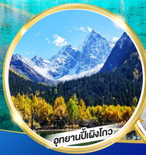
อุทยานปี่ผิงโกว