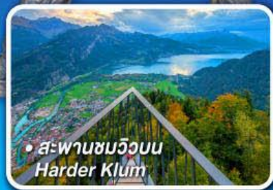
• สะพานชมวิวกบ Harder Klum