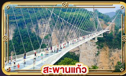
สะพานแก้ว