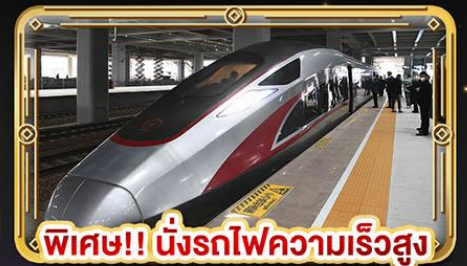
พิเศษ!! นิ่งรถไฟความเร็วสูง