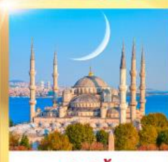
สุหรัสน้ำเงิน