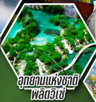
อุทยานแห่งชาติ พลิตวิเซ