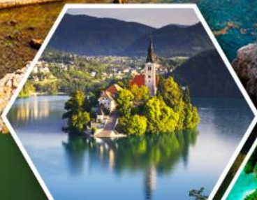
ทะเลสาบเบลล