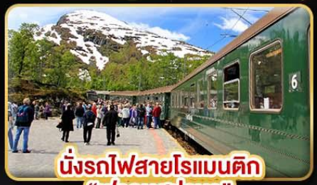
นั่งรถไฟสายโรแมนติก “ฟรอมสปาน่า”