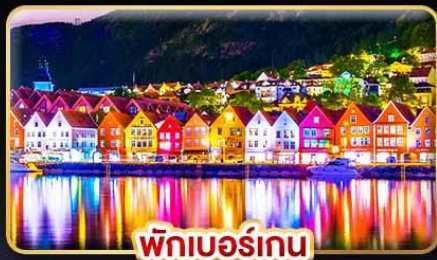
พิกเบอร์เกน