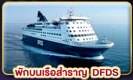
พิกบนเรือสำราญ DFDS