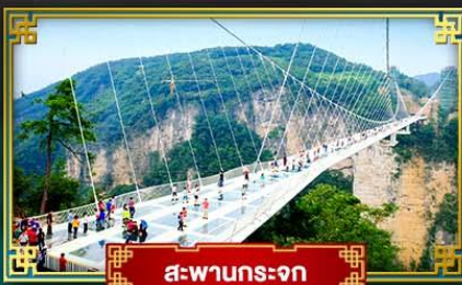
สะพานกระจก