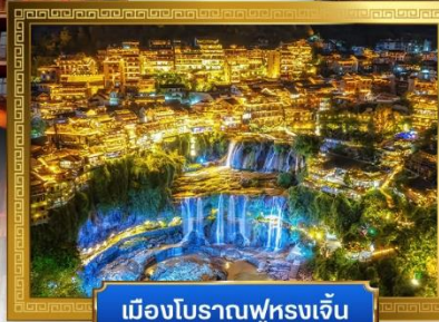
เมืองโบราณฟูหรงเจิ้น