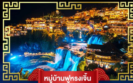
หมู่บ้านฟูรงเจิน