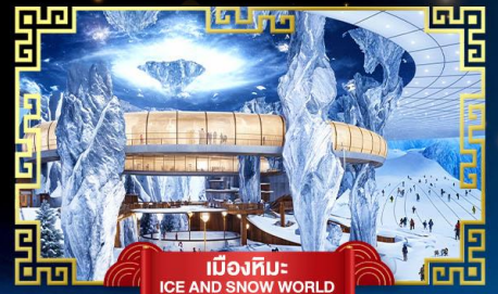
เมืองหิมะ ICE AND SNOW WORLD