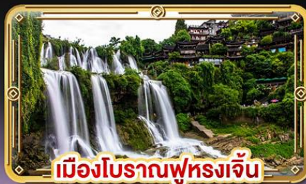
เมืองโบราณฟุหลงเจิ่น