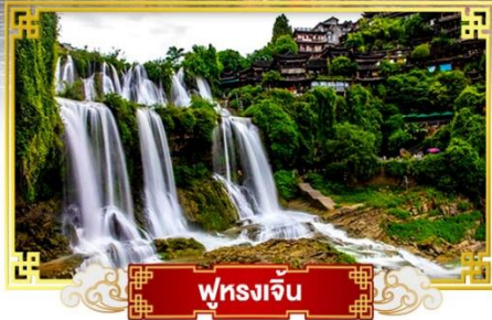
ฟุรงเจิน