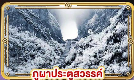
กัวปาประตูสวรรค์