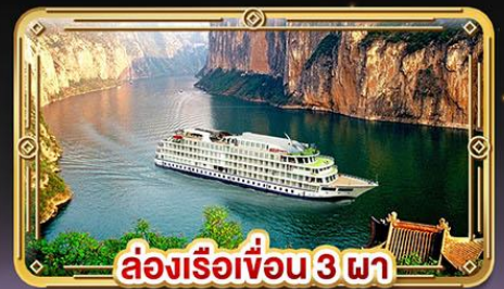
ล่องเรือเขื่อน 3 ภา