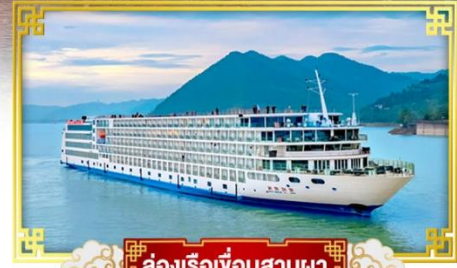
ล่องเรือเขื่อนสามผา