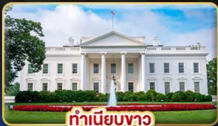
ทำเนียบขาว