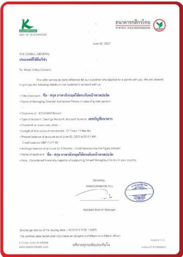
ตัวอย่าง Bank Guarantee ที่ผู้สมัครต้องยื่นกับธนาคาร