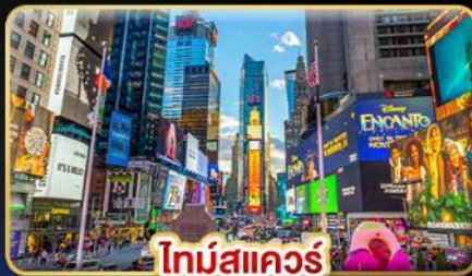
ไทม์สแควร์