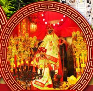
วัดเจ้าแม่กวนอิม ฮ่องอ๋า