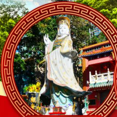
เจ้าแม่กวนอิมหาคีรีพิศลัสเบย์