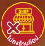
ไม่ลงร้านช้อปปิ้ง