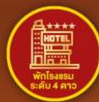
พักรีสอร์ท ระดับ 4 ดาว