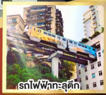
รถไฟฟ้าทะลุคิต