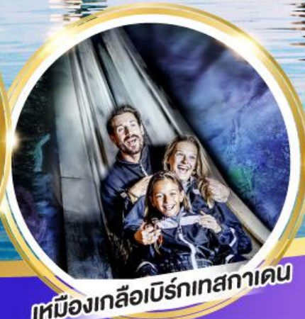
เหมืองเกลือเบิร์กเทสกาเดน