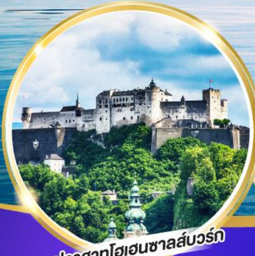
ปราสาทโฮเฮนซอลส์บวร์ก