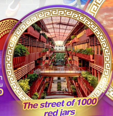
The street of 1000 red jars

สักการะพระใหญ่หลิงซานต้าฟอ ถ่ายรูปคู่กันดิมยักซ์ ชมสุดยอดพุทธศิลป์ร่วมสมัยของจีน "ศาลาฟานกง"