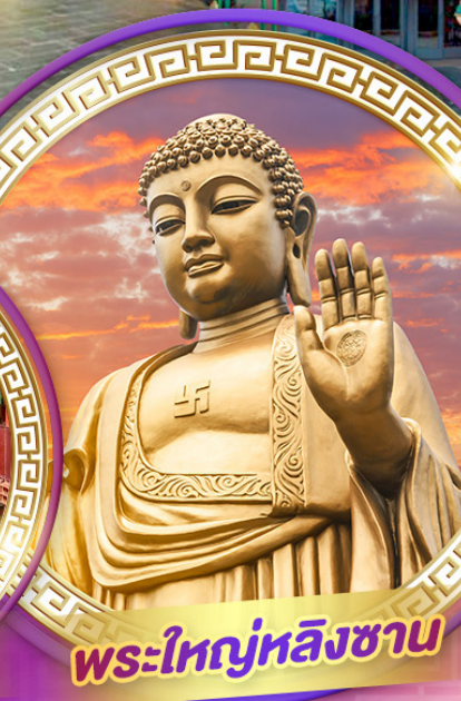
พระใหญ่หลิงซาน