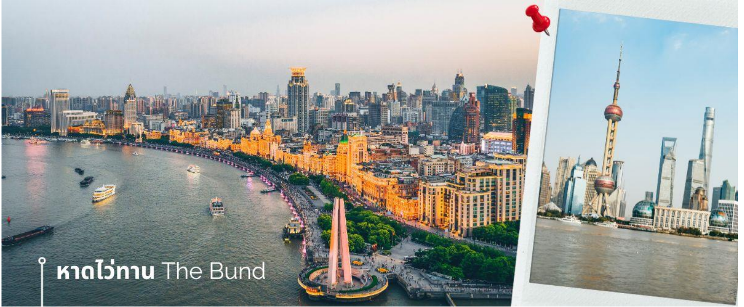
หาดไวทาน The Bund

นำท่านสู่บริเวณ หาดไวทาน ตั้งอยู่บนฝั่งตะวันตกของแม่น้ำหวงผู้มีความยาวจากเหนือจรดใต้ถึง 4 กิโลเมตรเป็นเขตสถาปัตยกรรมที่ได้ชื่อว่า “พิพิธภัณฑ์สิ่งก่อสร้างหมื่นปีแห่งชาตินจีน” ถือเป็นสัญลักษณ์ที่โดดเด่นของนครเซี่ยงไฮ้