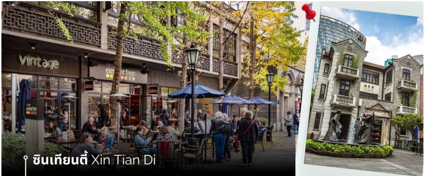
📍 ซินเทียนตี้ Xin Tian Di

นำท่านเที่ยวชม ซินเทียนตี้ ย่านฮิปเตอร์ใจกลางนครเซี่ยงไฮ้ ที่วัยรุ่นต้องมา กลายเป็นสถานที่ท่องเที่ยวติดอันดับต้นๆไปแล้ว สำหรับแหล่งช้อปปิ้งแห่งนี้ ไม่แพ้แหล่งช้อปปิ้งรุ่นพี่ อย่าง ถนนนาหนิง ถนนอูเจียง Yu Yuan Bazaar ถือว่าเป็นอีก 1 ไฮไลท์เด็ดของนครแห่งนี้ เนื่องจากเอกลักษณ์ที่ไม่เหมือนใคร สิ่งปลูกสร้างที่ใช้อิฐบล็อกแบบสถาปัตยกรรมแบบ Shikumen (ซิกเหมิน) การผสมผสานระหว่างสถาปัตยกรรมตะวันตกกับจีนเข้าด้วยกัน ทางเดินหิน กำแพงหิน ประตูหิน บ้านเมืองเก่าแต่ดูแลรักษาอย่างดี