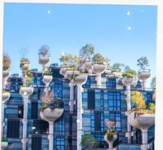
Tian An 1,000 Trees Square