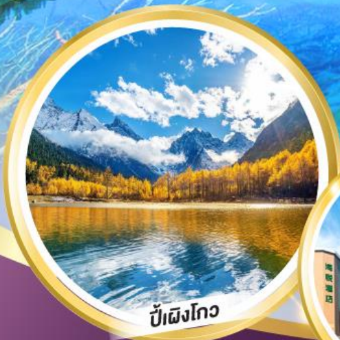
ปี้เฉิงโกว