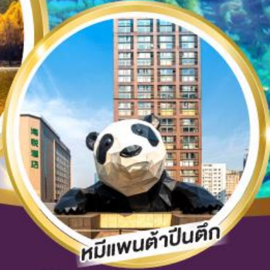
หมิปันด้าปิ่นตึก