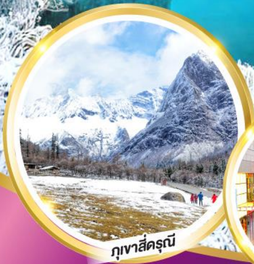
ภูเขาสี่ดรุณี