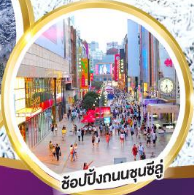
ช้อปปิ้งถนนชุนชิว