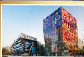
ช้อปปิ้ง SANLITUN