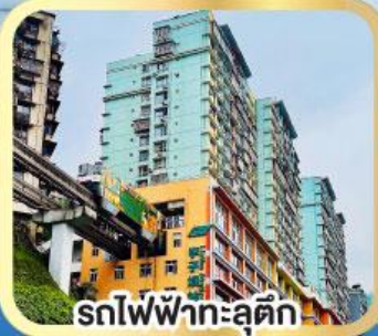
รถไฟฟ้าทะลุติ๊ก