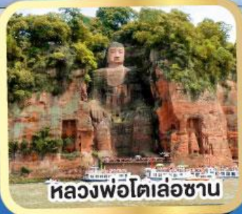
หลวงพ่อดเล่อซาน