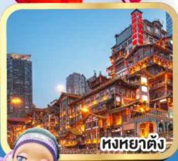
หงหยาดัง