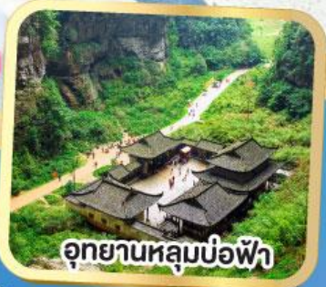
อุทยานหลุมบ่อฟ้า