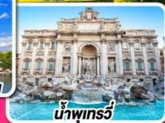
น้ำพุทรี