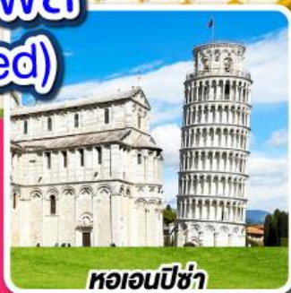
หออนปิซ่า