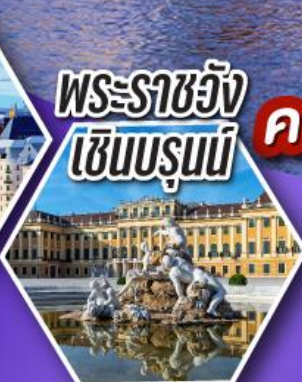
พระราชวัง เซินบรุนน์