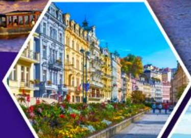
คาร์ลสวูร์ท